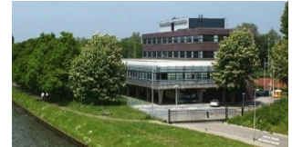
Nationaal Denksport Centrum "Den Hommel" Kennedylaan 9 3533 KH Utrecht

Aan het toernooi is een goed doel verbonden. Een deel van de sponsorgelden gaat naar de Stichting Colombine, die in het Colombinehuis in Biddinghuizen voor jonge, langdurig zieke kinderen met hun gezin een korte vakantie verzorgen.